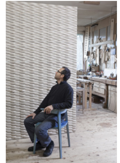
Stuhl toro und Eichen-Schrank ondulato mit integrierter Griffleiste. Links, Strickwand mit Schutzschicht-Rest. / Chaise toro et armoire en chêne ondulato avec prises intégrées. À gauche, paroi poutre sur poutre avec reste de couche protectrice.

Text Eva Holz / Form Forum Schweiz