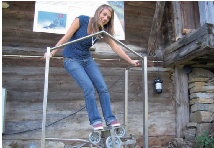
Auf dem Weltcuptrail kann man einiges selber ausprobieren: Zum Beispiel Carven wie die Skirennfahrer.

1 Starthaus Hier schnellen die Rennfahrer mit aller Kraft aus dem Starttor und beschleunigen innert weniger Sekunden auf 80 km/h – Zum Ausprobieren: Ermitteln Sie, wer die oder der Schnellste Ihrer Wandergruppe ist!