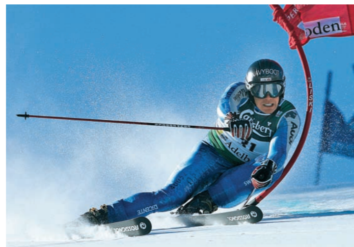
Das Können und die Dynamik der Skirennfahrer begeistert in Adelboden jedes Jahr gegen 30'000 Zuschauer und Zuschauerinnen.