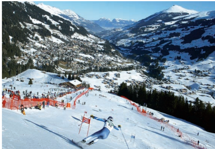
An zehn Posten eröffnen Infotafeln mit Fotos und Texten einen besonderen Blick auf den Skiweltcup in Adelboden.

8 Giisbruni Hier stehen Sie im schwierigsten Zielhang der Welt. Der fürchterliche Sturz des Amerikaners Daron Rahlves sorgte 2005 für Aufsehen. – Zum Ausprobieren: Wenn Sie mit den Pedalen genügend Energie produzieren, erscheint der Sturz nochmals auf dem Bildschirm.