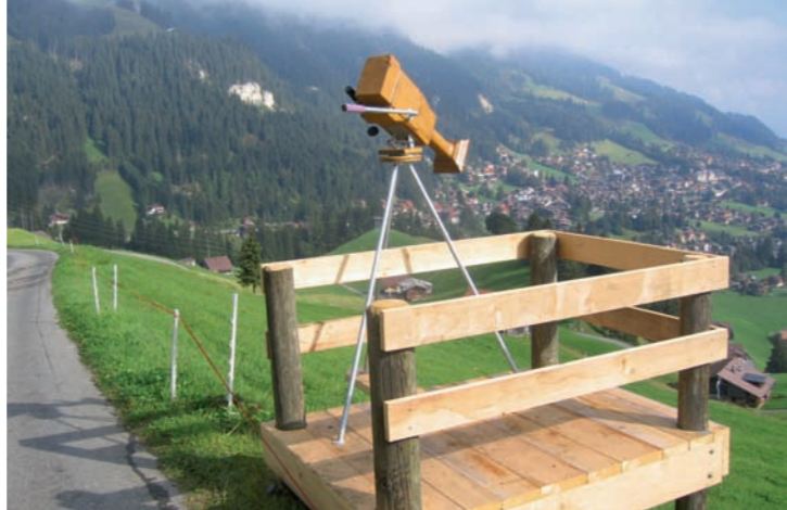
Entlang der Weltcupstrecke gibt es für Gross und Klein Interessantes zu entdecken.

5 Wintertal Eine Strecke ohne Kunstschnnee? Heute undenkbar. – Zum Ausprobieren: Testen Sie Ihre Kraft an der Wasserpumpe!